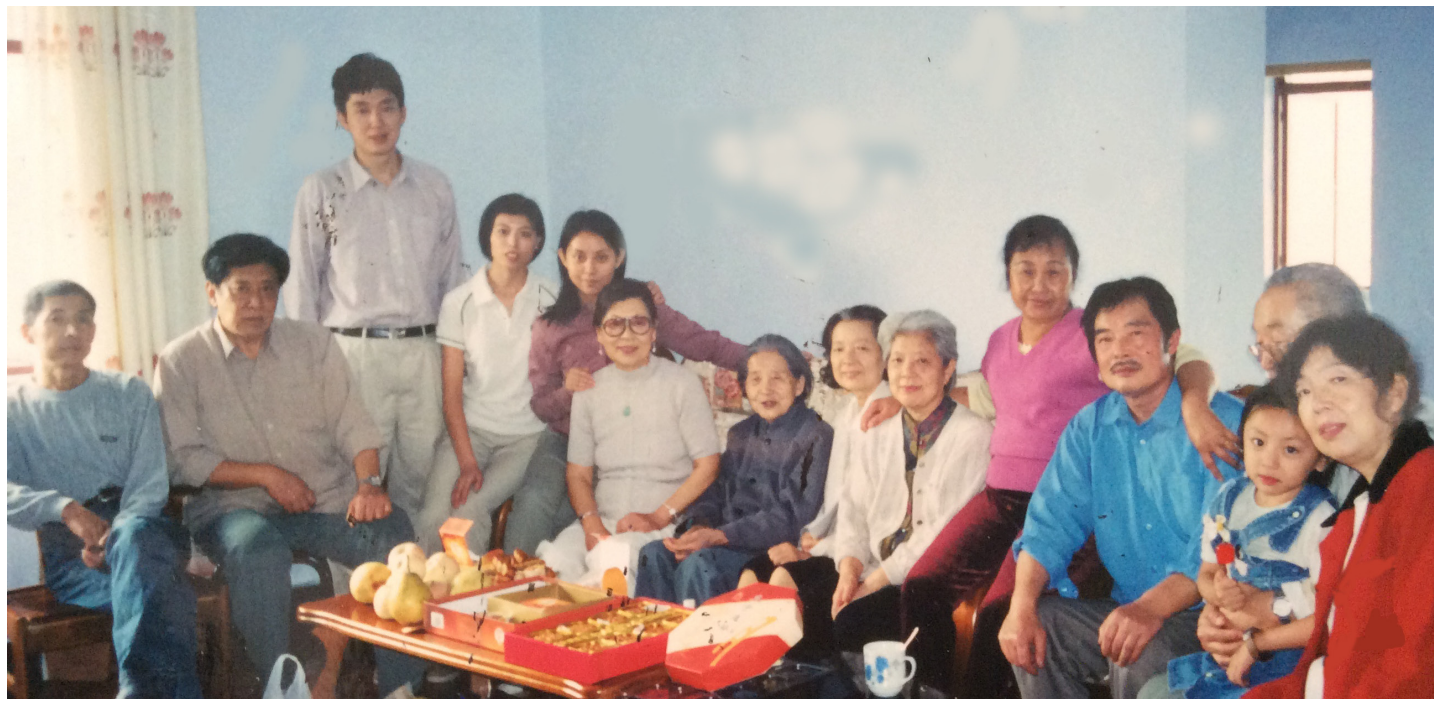
2002年，作者（左六）和母亲（左七）与亲人们合影

1998年当我即将离开同儿孙们住了五年的旧居时，我的视线环扫着空荡荡的屋子，总有一份难舍之情。但心中最难割舍的，是后院里的那棵核桃树。我走到厨房窗前，向外眺望，许久、许久……我情不自禁地走到核桃树旁，伸手摸摸树枝、摸摸树叶，最后狠心地摘下了一片嫩绿叶子，并将它压进一本杂志，小心地保存了起来。这是母亲亲手种的核桃树啊！