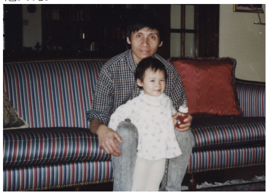
年幼的思思与父亲在一起

他睁开双眼，眼前却一片漆黑，他什么都看不到！医生刚刚为他的一只眼睛做了疏通泪腺手术，因为在过去的三个月里，每天晚上他都因妻子的离世悄悄地哭泣，以致一只眼睛失明。可手术后两只眼睛都看不见更是吓坏了他，他还有一个九岁的女儿需要养育，他心中还有一个梦想需要这双眼睛帮助他实现。