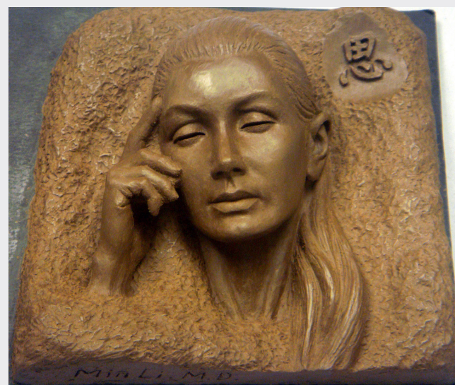
正如为女儿起名字的初衷，父亲为女儿雕刻的“思考者”，希望女儿做一个用心思考的人。

As a final thought, I would like to say that people do change. Your experience in your high school career is not indicative of your future career. Just because you got straight As in high school, does not mean you will necessarily get straight As in life. Conversely, just because you failed every math test in high school does not mean you will fail every test in life either. You are done with high school, but that does not mean you have finished learning and changing. Each year, 98% of the atoms in your body are replaced by new ones. You are very literally a new person every year, so continue to make the right choices and fight for the life you want. Best of luck, Class of 2014. Godspeed.