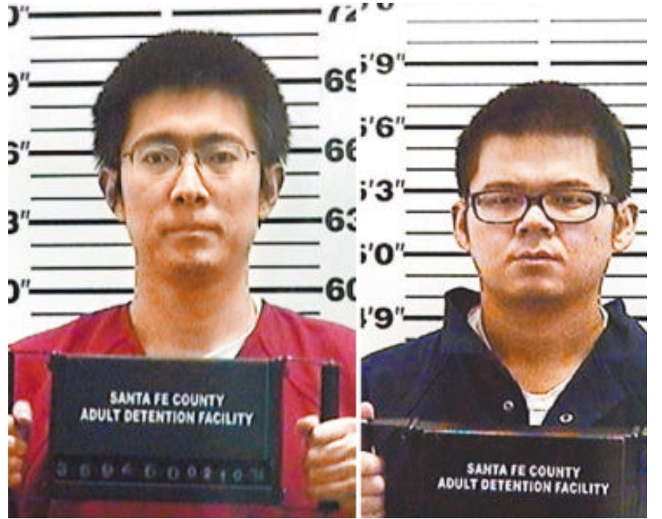
两名被指控走私军用传感器的中国人