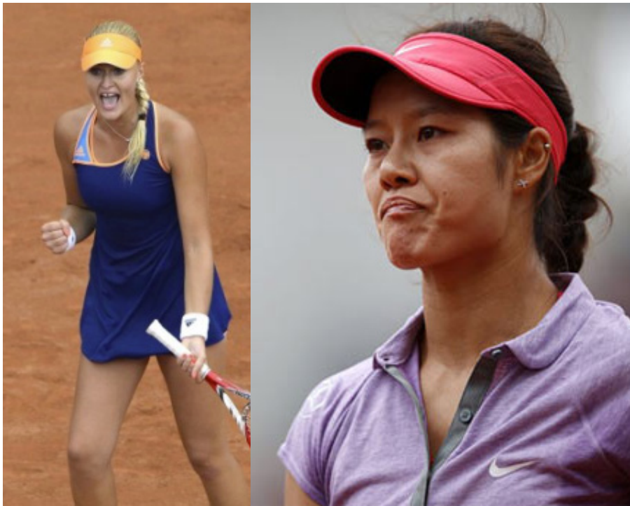
左图：东道主黑马庆祝爆冷；右图：李娜惨败。

李娜是今年的澳网冠军，她在法网未能取得开门红，而男单冠军瓦林卡也是首轮爆冷出局。澳网冠军在法网双双首轮出局，这也是大满贯史上头一次。李娜输球后不久，彭帅也首轮遭到淘汰，这样本次参加法网正赛的四位中国球员郑洁、张帅、李娜和彭帅全部首轮出局，巴黎的春天，对两位澳网冠军和四朵中国金花，都比较寒冷。