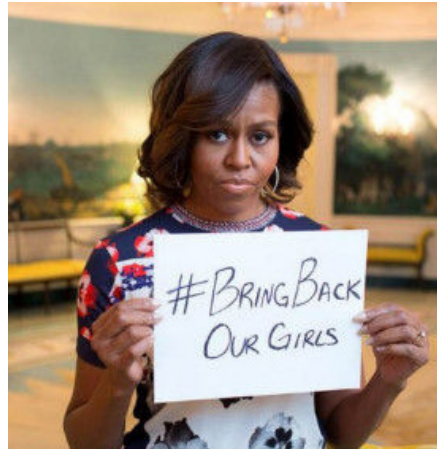
在推特上，#bringbackourgirl已经成为连日来最热门的标签。美国第一夫人米歇尔日前在推特上高举一张写有该标语的白纸。米歇尔在推特上说：“我们的祷告与失踪的尼日利亚女孩及他们的家人同在，是时候让我们的女孩回家了。”在其带动下，世界各地网友纷纷上传手举标语照，呼吁拯救女孩。

“博科圣地”于2003年在尼日利亚境内诞生，主要在该国北部地区活动，该组织名称的意思是“西方教育是被禁止的”。随后，2009年该组织同尼日利亚安全部队爆发了流血冲突，导致了该组织800多人死亡，其中包括该组织的领