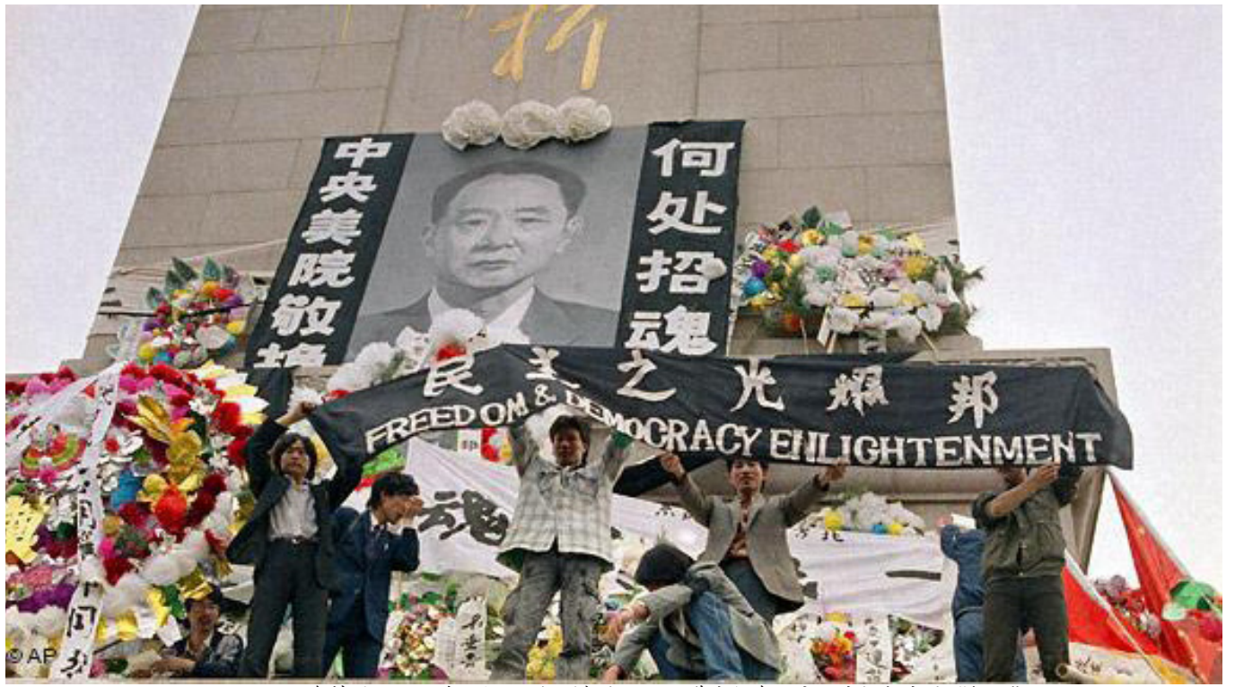
资料图：1989年4月15日胡耀邦逝世后，学生们在天安门广场打出的“祭语”。

在胡耀邦逝世25周年纪念日上，胡耀邦的第三个儿子胡德华接受记者采访时说：“我父亲心目中要建成的国家不应该就听一个人讲话，应该每