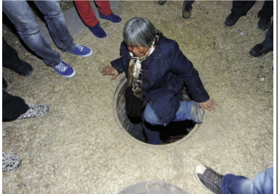
2013年12月5日，北京朝阳区丽都广场南门附近，多处井下不足3平米的简陋空间里，住着一些白天外出谋生、晚上下井居住的人。图为一名老太太下井“回家”，随后，官方将这些居住井封起来。