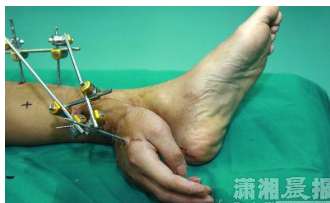
“这真真太疯狂了，怎么做到的？”@lajornada “谁说亚洲人不会跳出常规思考？”@StanPat “中国医学干得好。”@Sunfire “这是假的，是中国人的宣传战，像他这样的普通中国人只会等死，腐败政府不会拯救伤者。”@kommander