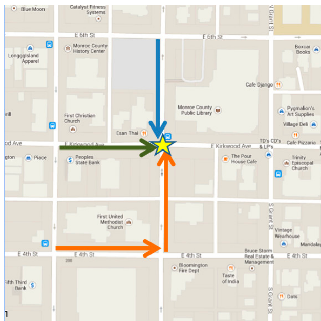
(图为IU Homecoming 游行路线示意图)

更多返校周的活动详情, 请查看 http://alumni.indiana.edu/together/homecoming/index.html 。我们期待在路途中见到大家的身影! 11月1日晚Downtown不见不散! 带上你的小伙伴前来狂欢吧!