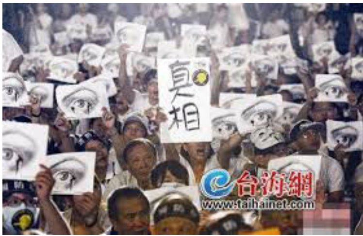
台湾民众在总统府前集会，要求军方对洪仲丘案真相作出交代。

以及军事检察署是否具专属管辖权，引起台湾社会高度关注，并促成公民1985行动联盟行动，要求军队社会化，并于非开战时将军人从军法全面改由民间司法审判。