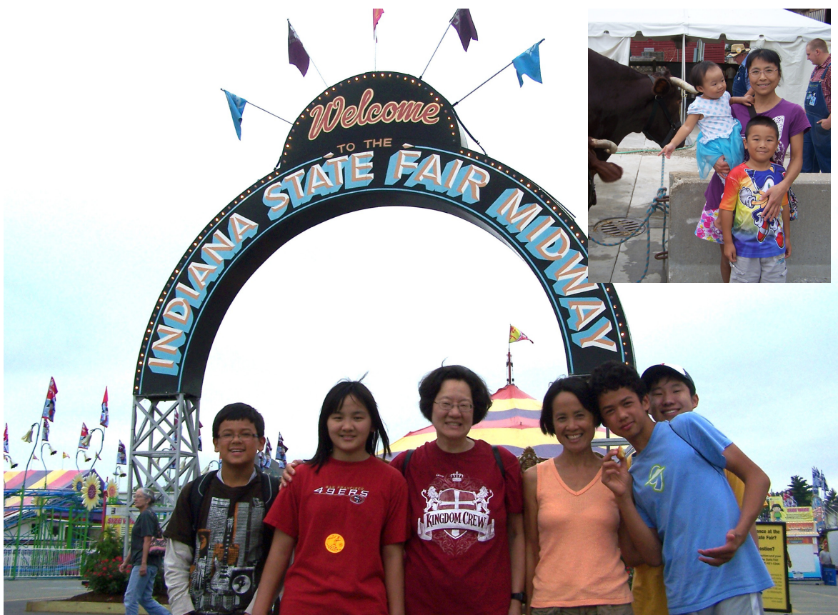
(←上接第1版“相聚印州博览会”)

欢迎读者朋友提供更多的体育娱乐信息! (aatodayin@gmail.com)