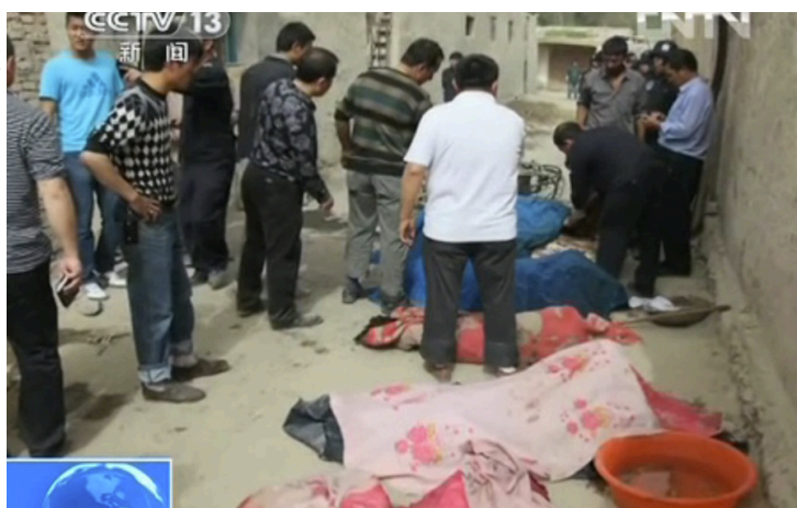
派出所，将派出所档案室和民警宿舍点火焚烧，被击毙。

后续赶来的乡镇干部及民警相继遭受设伏团伙成员的袭击，民警击毙团伙成员1名，1名乡镇干部遇害，2名民警重伤后不治身亡，此后，4名团伙成员冲出巷道打砸烧毁车辆，在冲击镇政府时1人被击毙，另3人劫持一辆三轮摩托车转向向